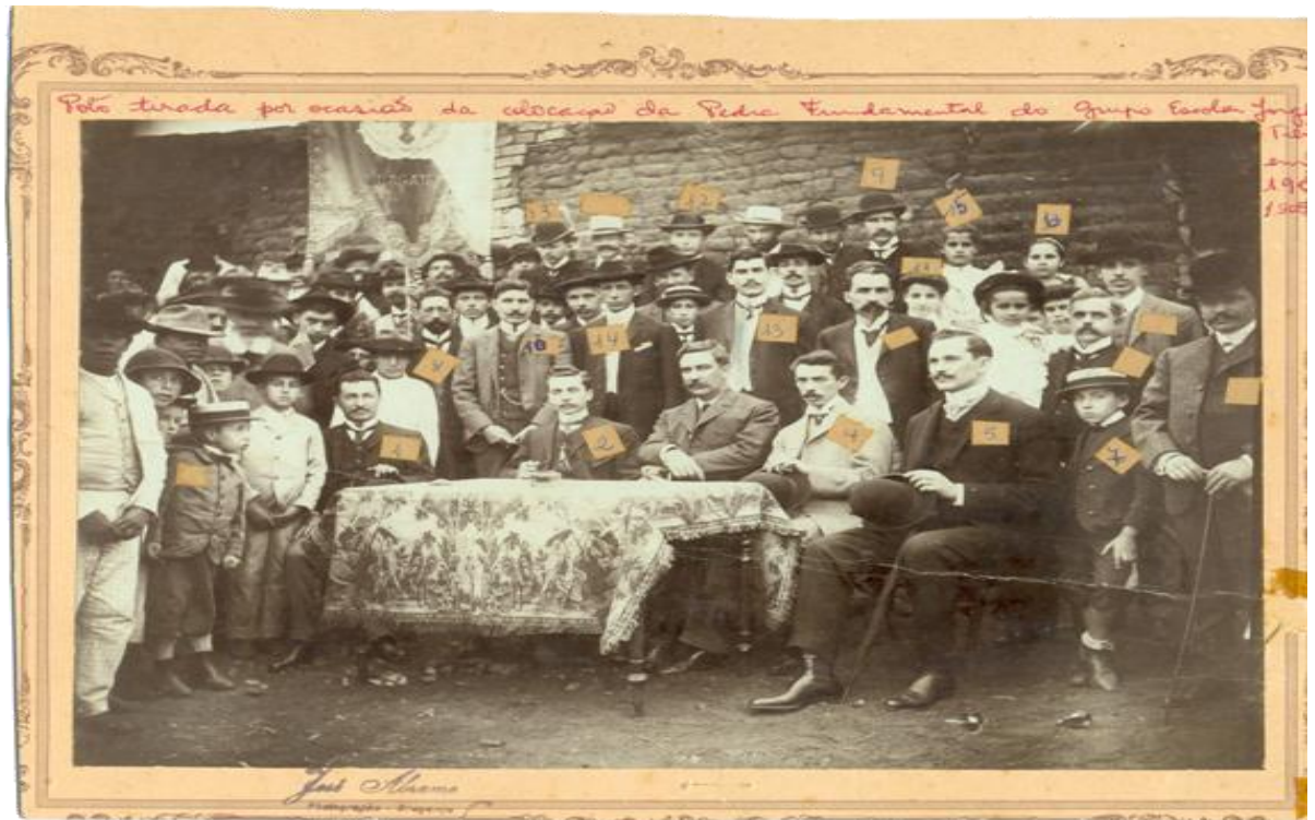
Fotografia 6: Colocação da pedra fundamental do Grupo Jorge Tibiriçá – Data 1906.