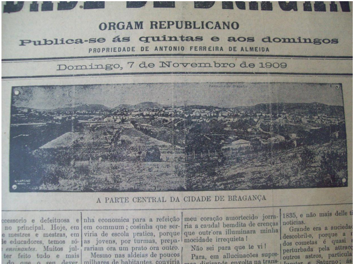
Fotografia 2: Parte central da Cidade de Bragança – Jornal Cidade de Bragança , 1909.