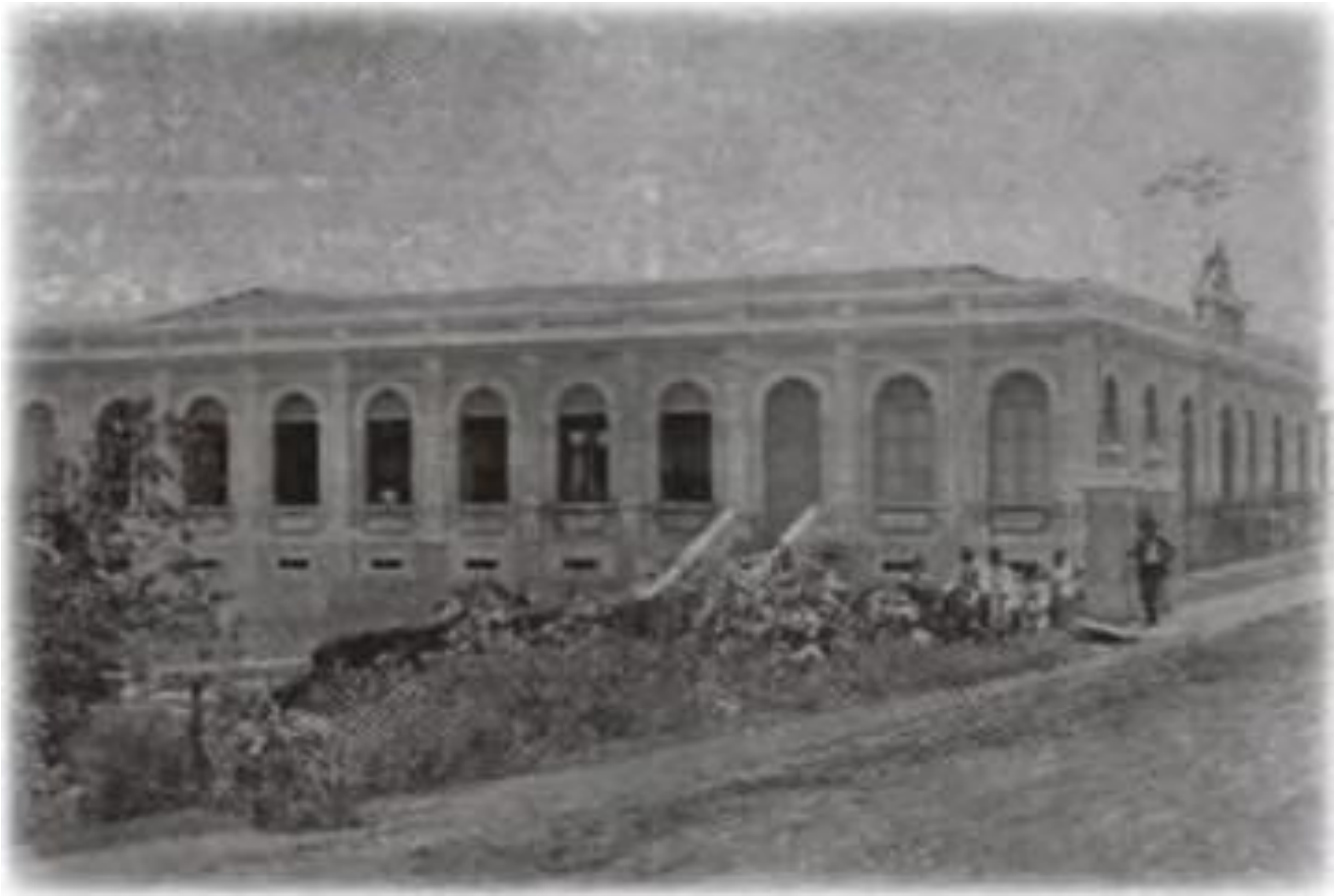
Fotografia 7: Grupo Escolar Dr. Jorge Tibiriçá.