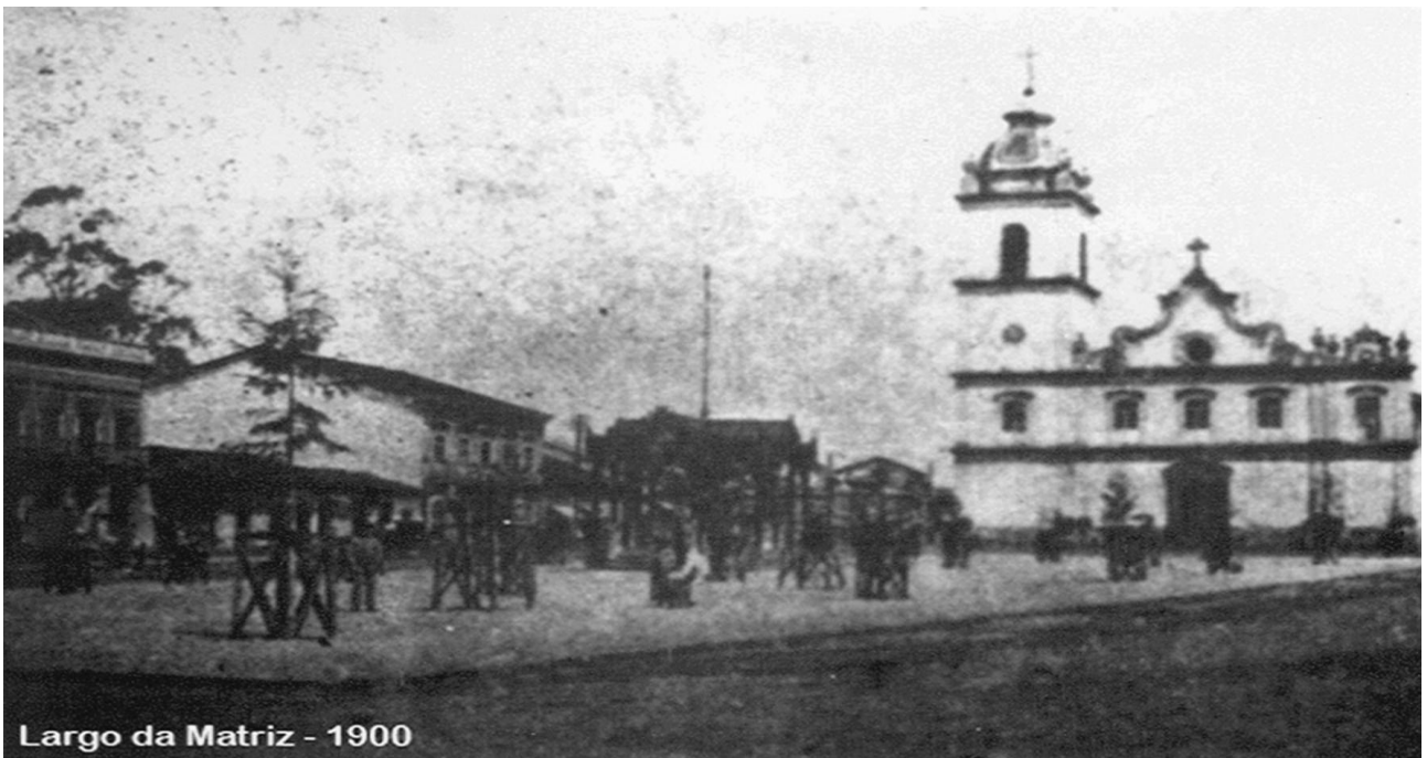
Fotografia 3: Largo da Matriz, 1900.

Bragança se formou em torno de uma capela, como várias cidades brasileiras. De acordo com os almanaques da cidade, em 1765, o povoado já havia crescido e recebeu o título de freguesia; em 1797 passou a Vila e, em 1856, a cidade. Bragança tinha suas principais atividades econômicas tanto na cafeicultura como no cultivo de cereais exportados (BUENO, 2007; ISHIZU, 2009).