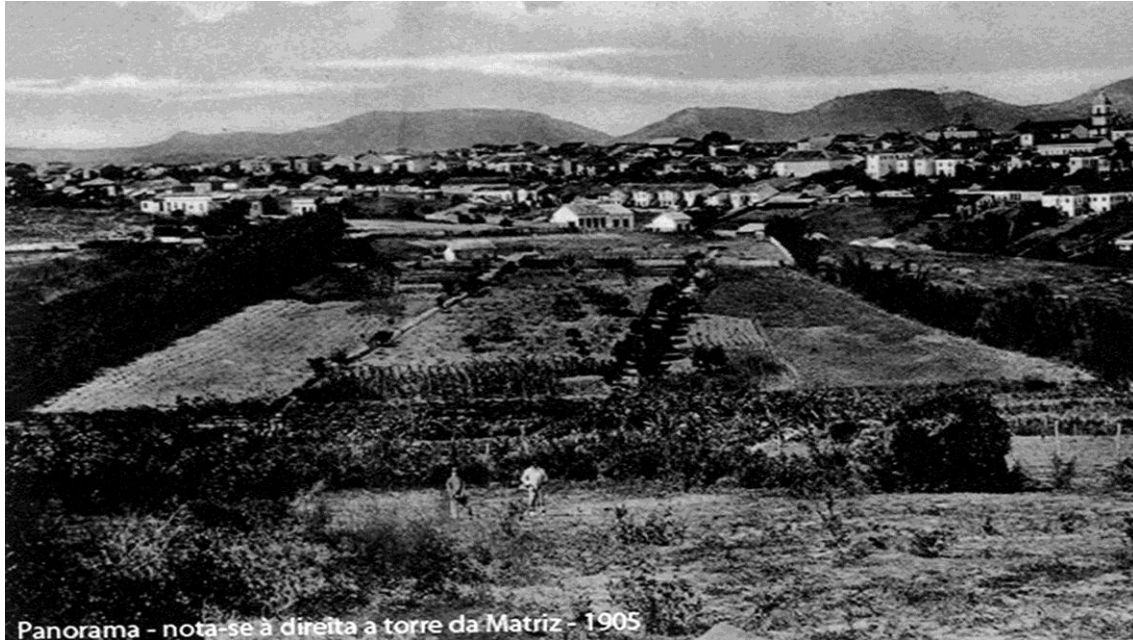
Fotografia 5: Foto panorâmica de Bragança, 1905.

de inclusão/exclusão dentro dessa cidade que tinha por projeto liberal a formação do cidadão bragantino.