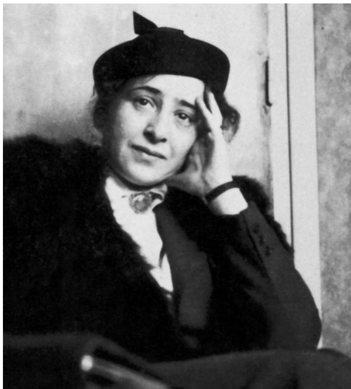
Figura 5: Hannah Arendt