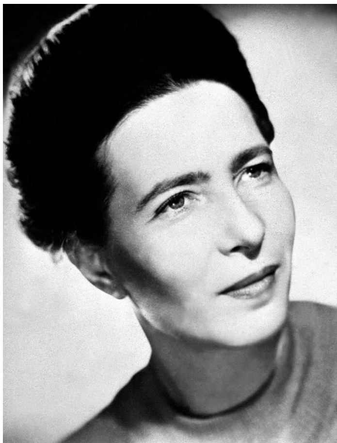
Figura 7: Simone de Beauvoir