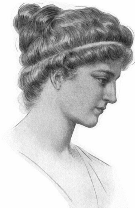
Figura 6: Hipátia de Alexandria