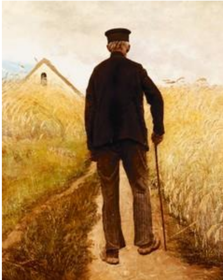
Figura 10: Idoso caminhando no campo de centeio, s/d, Laurits Andersen Ring.

Nesta terceira parte apresento histórias cruzadas sobre as formações continuadas em que os formadores de professores atuavam, buscando compreender como foi se constituindo esse grupo, e cada formador, com seus anseios e empecilhos. Também apresento a constituição de um grupo de formadores em específico: os formadores de professores de matemática. Tecer comentários sobre ele se faz necessário, pois o percebo como um grupo atuante dentro do Programa “São Luís Te Quero Lendo e Escrevendo”.