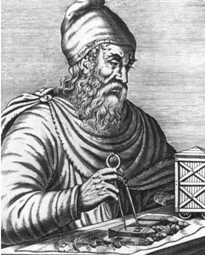
Figura 4: Arquimedes de Siracusa