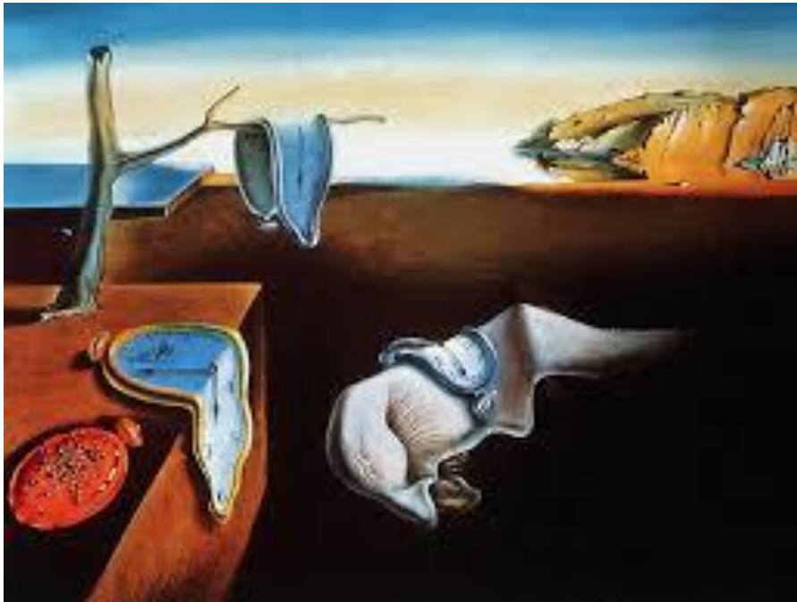
Figura 1: A Persistência da Memória, 1931, Salvador Dalí.