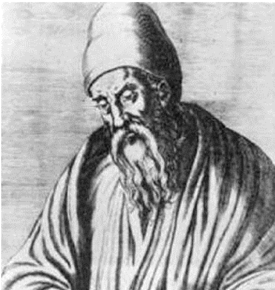
Figura 3: Euclides de Alexandria