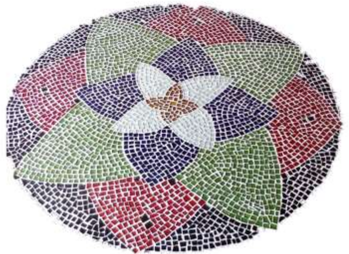
FIGURA 1: Flor e ser