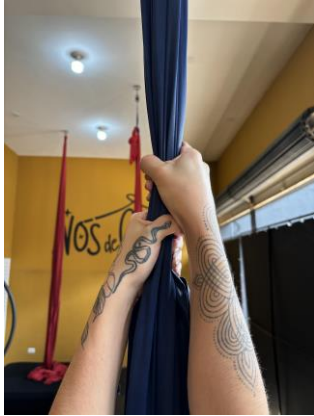
Figura 1 – Empunhadura supinada, desvio ulnar e flexão dos dedos