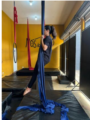
Figura 2 - Flexão de cotovelos, mantendo força isométrica.