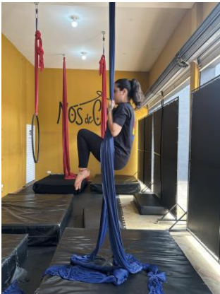
Figura 7 - Retroversão de quadril e extensão de cotovelos.