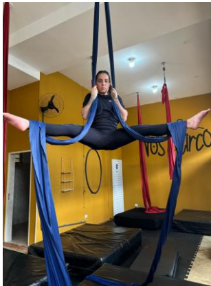
Figura 7 - Tronco e membros superiores a frente dos tecidos.

Abdução de quadril e rotação lateral dos membros inferiores.