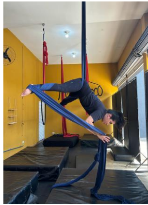
Figura 12 - Extensão e adução de quadril, flexão de joelhos e extensão de coluna vertebral.