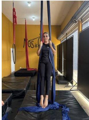
Figura 2 - Flexão de cotovelos, mantendo força isométrica.