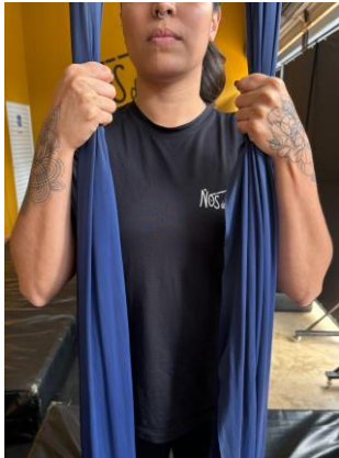
Figura 1 - Pega supinada