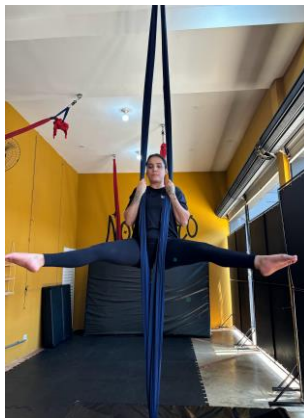
Figura 2 - flexão de quadril com joelhos estendidos. Abdução de quadril e rotação lateral dos membros inferiores.