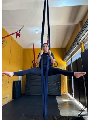
Figura 4 - extensão e adução de quadril com joelhos flexionados.