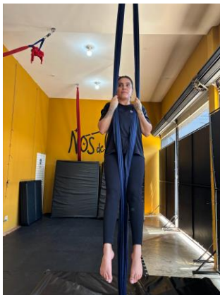
Figura 1 - Flexão de cotovelos mantendo força isométrica.