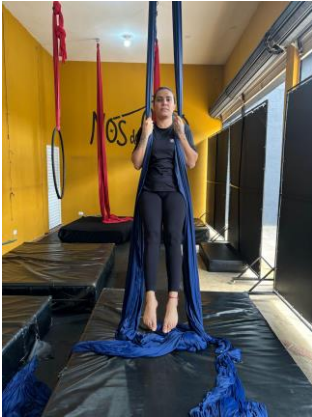
Figura 3 - Retroversão pélvica com braços estendidos.