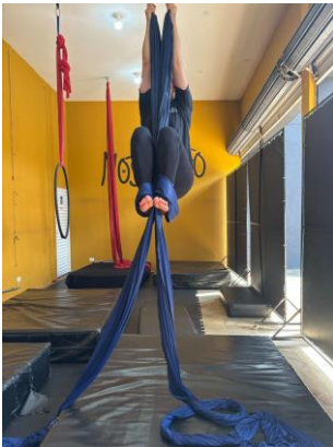
Figura 7 - Flexão de ombros, flexão de quadril e joelhos.