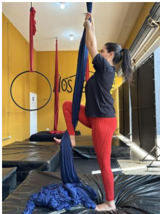
Figura 3 - Flexão de quadril e joelho e dorsiflexão.