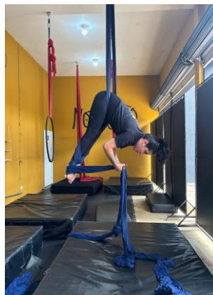
Figura 10 - Abdução de quadril.