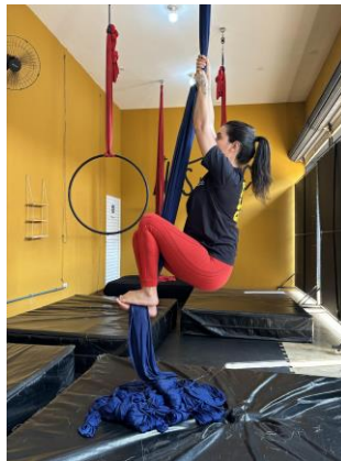
Figura 4 - Flexão de quadril e joelhos e dorsiflexão.