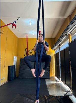
Figura 5 - flexão de quadril com joelhos estendidos. Abdução de quadril e rotação lateral dos membros inferiores.