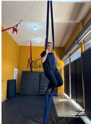
Figura 6 - extensão de quadril e de joelhos, com