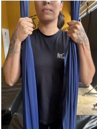
Figura 1 – Pegada supinada.