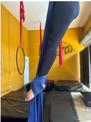
Figura 9 - Extensão de joelhos e quadril, flexão plantar.