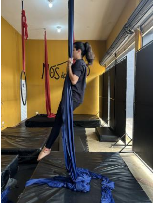
Figura 5 - Flexão de quadril e de joelhos.