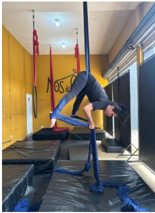
Figura 11 - Extensão e abdução de quadril.