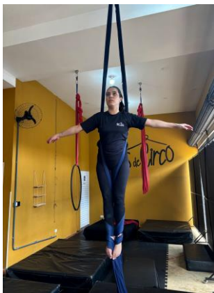
Figura 9 - Abdução de quadril.