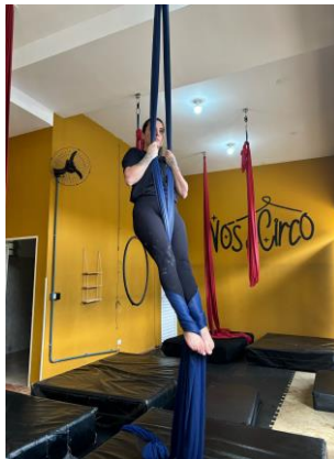
Figura 8 - flexão de tronco pegando os tecidos por baixo das plantas dos pés.