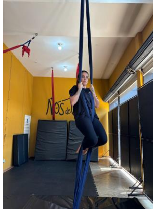
Figura 6 - extensão de quadril e de joelhos, com duas enroladas de tecidos.