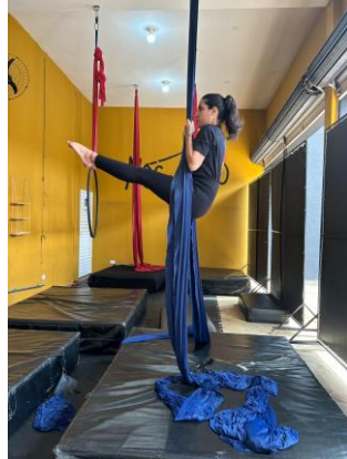
Figura 5 - Retroversão pélvica com braços estendidos.