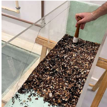
Figura 01 – Compactação da Primeira Camada - Basalto + Cascalho.

Após a coleta das amostras foi dado início a realização do experimento começando pela fixação da manta para drenagem no fundo da caixa de acrílico, para composição do talude a primeira camada foi de basalto + cascalho com adensamento de 25 golpes manuais utilizando o pistilo cerâmico finalizando com uma camada de compactação igual a 2,5cm, a segunda camada a ser compactada com 25 golpes manuais foi a de areia que resultou em uma camada de 9,5cm, a terceira camada foi a de silte que também foi compactada com 25 golpes manuais e teve uma altura de 7cm, a quarta e última camada do talude foi a de argila que também teve sua compactação com 25 golpes e finalizando com uma camada compactada de 7cm.