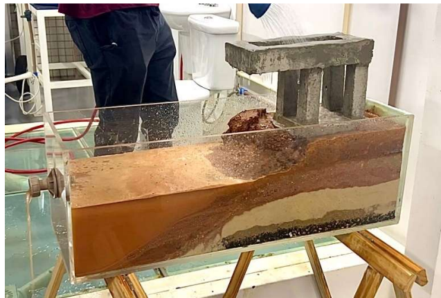
Figura 06 – Realização do Segundo Tempo.

No final do segundo tempo já foi possível notar uma erosão generalizada no talude, onde parte da fundação já está exposta, observa-se também um avanço considerável de sedimentos no fundo do talude, além do nível d'água elevado