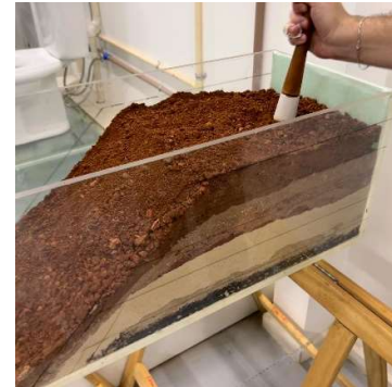
Figura 03 – Compactação da Última Camada - Argila.

Como a proposta de tornar o experimento mais fiel a realidade e proporcionar uma simulação mais completa, foi inserido no solo uma estrutura feita em concreto armado, com fundação do tipo estaca moldadas, vigas e pilares, simulando uma típica construção em área de risco.