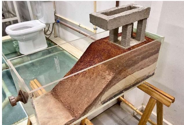
Figura 04 – Talude e Estrutura Finalizados.