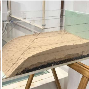
Figura 02 – Compactação da Segunda Camada - Areia.