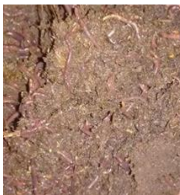
Figura 1 - Minhocas da espécie Eisenia Foetida

Para a realização das composteiras com minhocas, apresentadas na Figura 1, estas pertencem à espécie Eisenia foetida , conhecida como Vermelha da Califórnia, a espécie foi escolhida em razão da sua elevada taxa de reprodução, alta produção de vermicomposto e pela capacidade de se adaptar a diversos ambientes (SCHIEDECK et al; 2006). As minhocas que foram utilizadas foram compradas no Minhocário Mazzochi, localizado em Bragança Paulista (SP), sendo utilizadas 1000 minhocas por m 3 de resíduo sendo que cada composteira possui capacidade para 0,019 m 3 . A quantidade de minhocas adicionada as composteiras foi de aproximadamente 30 minhocas em cada.