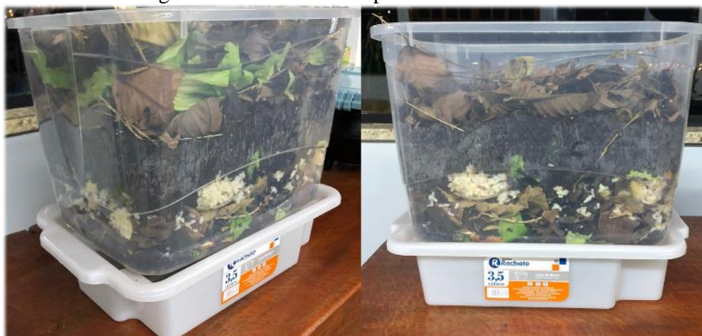
Figura 2 - Sistema de composteiras domésticas.