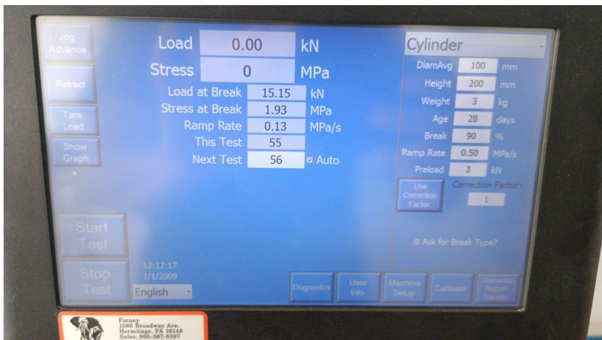
Figura 5 – Foto do resultado do teste 3,25% EPS (isopor). (Fonte: Próprio autor).