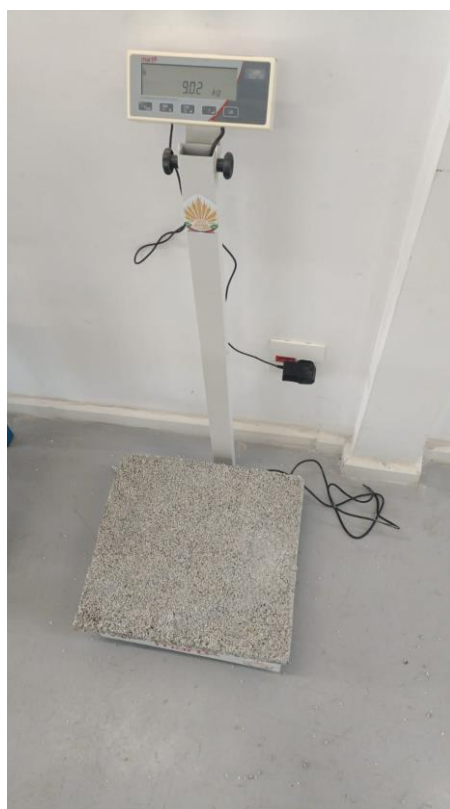
Figura 2 – Foto da balança - 50% de EPS, 9,02 kg, 45x45x8 cm (Fonte: Próprio autor).