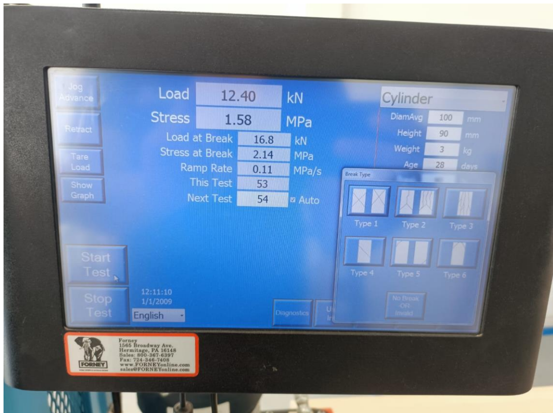
Figura 3 – Foto do resultado do teste 1, 0% EPS (isopor).