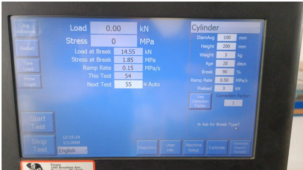
Figura 4 – Foto do resultado do teste 2, 0% EPS (isopor).