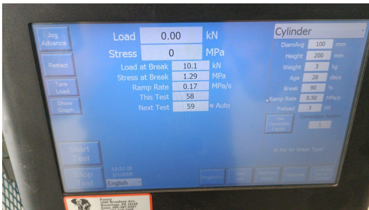
Figura 8 – Foto do resultado do teste 6,50% EPS (isopor). (Fonte: Próprio autor).