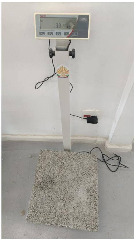
Figura 1 – Foto da balança - 25% de EPS, 13,31 Kg, 45x45x8 cm.